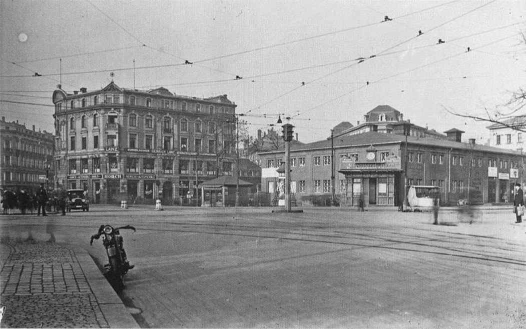
Messehalle auf dem Schulplatz

Lichte Raumhöhen unter den Querträgern ohne Kanäle für Klima-, Licht- und Stromtechnik im Bowlingtreff und mit entsprechend abgehängter Decke